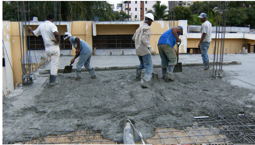
ALMACENES AMÉRICA Gustavo Mejía Ricart