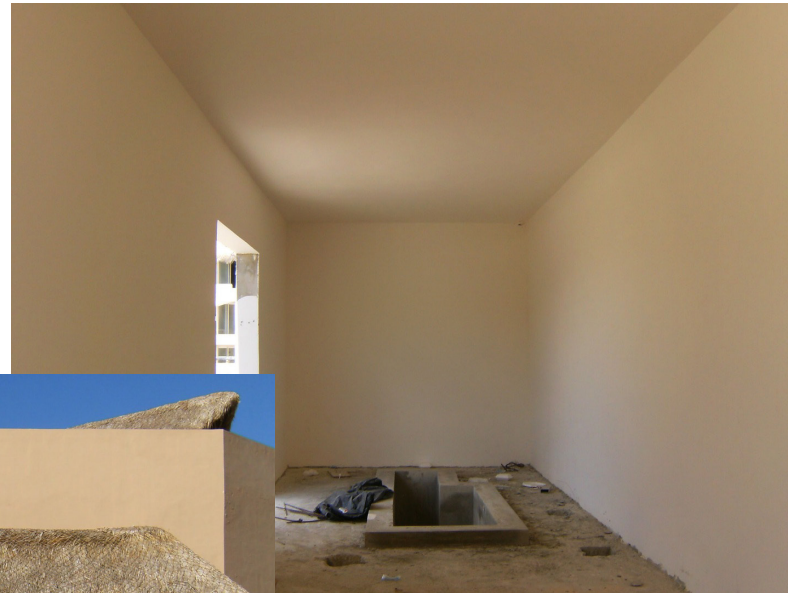
MOON PALACE PUNTA CANA Subestación